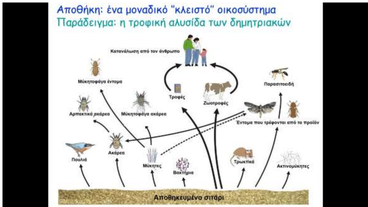
Εικόνα 1: Λεπτομέρειες από την παρουσίαση με σκοπό την κατανόηση της έννοιας της αποθήκης.

Παρακάτω παραθέτονται αποσπάσματα του εκπαιδευτικού υλικού (Εικόνες 1-3).