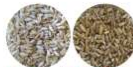
Σιτάρι επιπασμένο με γη διατόμων